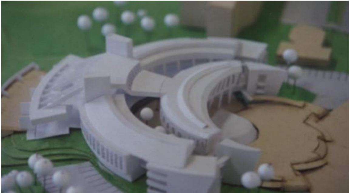
Figura 7. Maquete do projeto para o edifício atual do Curso.