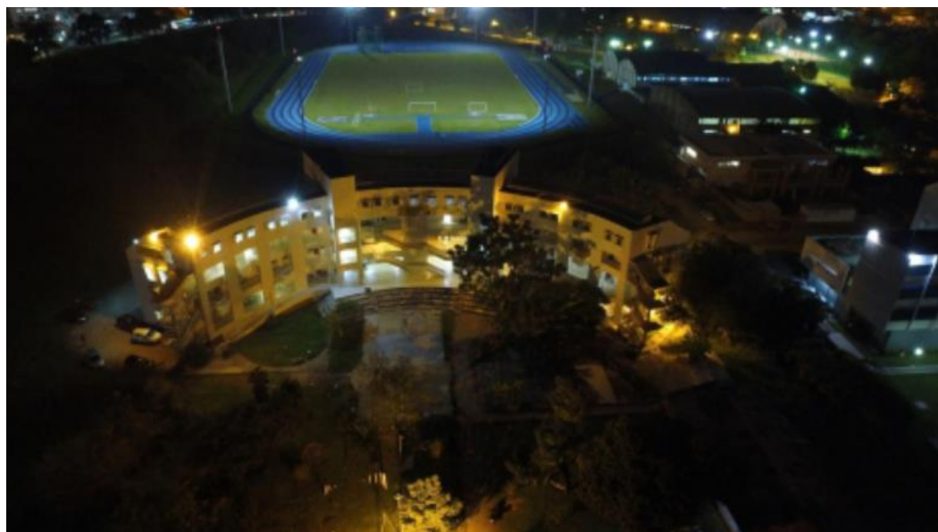
Figura 9. Imagem noturna da edificação atual do Curso.