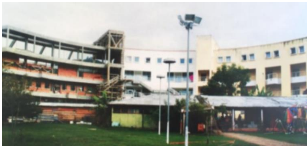
Figura 8. A construção em etapas do edifício atual do Curso.

urbanismo. É neste contexto que o presente projeto pedagógico aqui apresentado foi sendo debatido e pactuado.