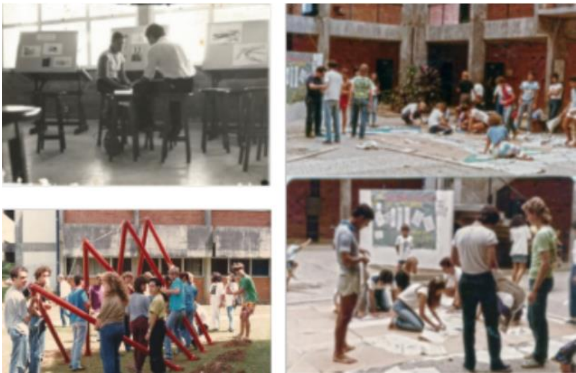
Figuras 1, 2 e 3. Atividades nas instalações dos cursos de engenharias.